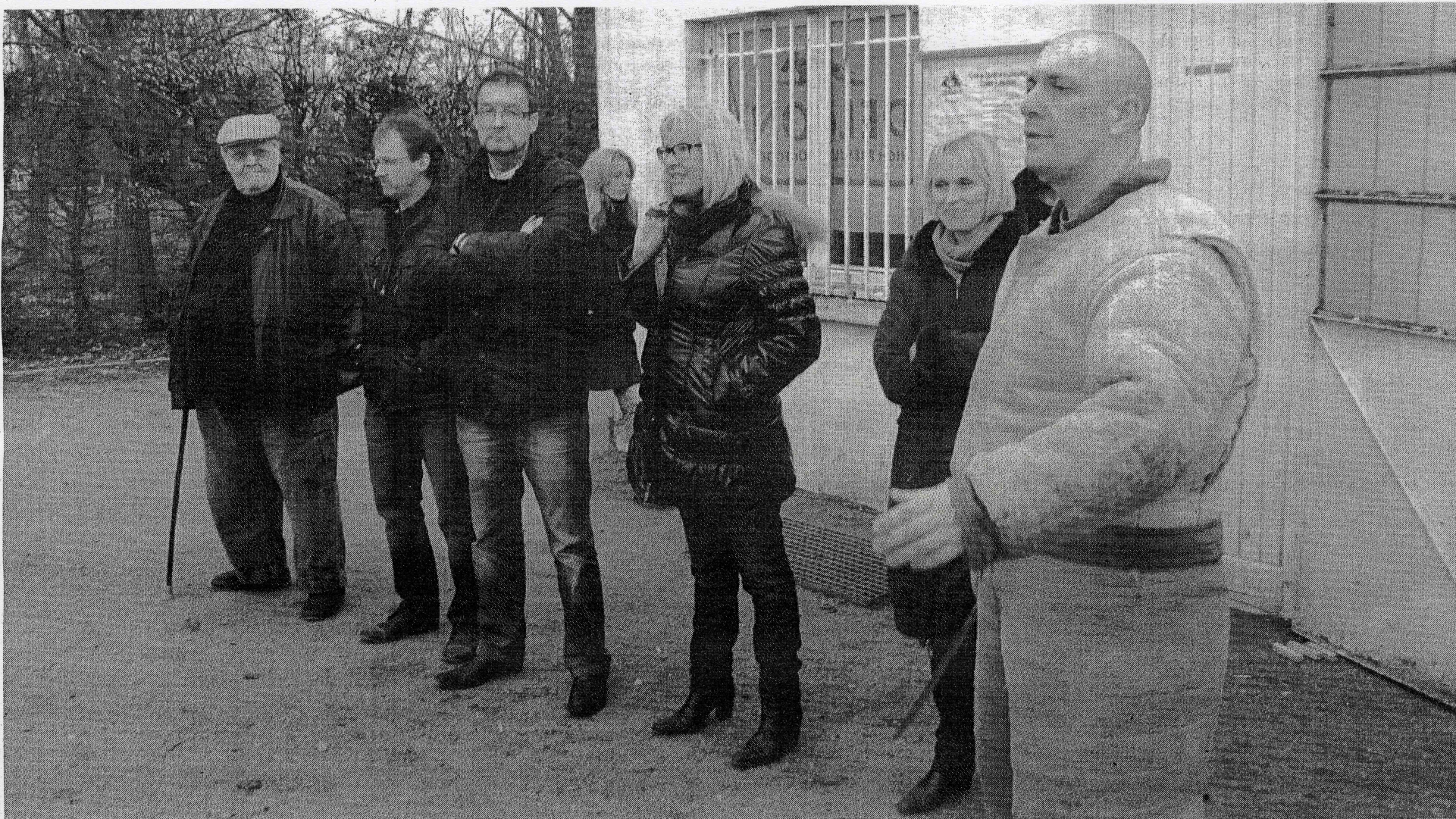
Les stagiaires ont eu droit à 315 heures de formation théorique pour travailler en toute confiance avec leur chien.

Depuis deux mois, huit stagiaires s'entraînent au centre de travail et d'éducation canine arrageois. Tous veulent devenir maître-chien.